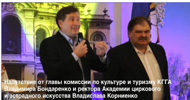
Напутствие от главы комиссии по культуре и туризму КГГА Владимира Бондаренко и ректора Академии циркового и эстрадного искусства Владислава Корниенко