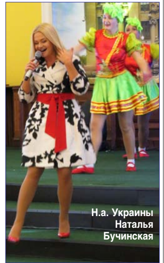
Н.а. Украины Наталья Бучинская

То, что любовь к национальным песням, танцам, культуре привлекают у нас повсеместно, не может не радовать.